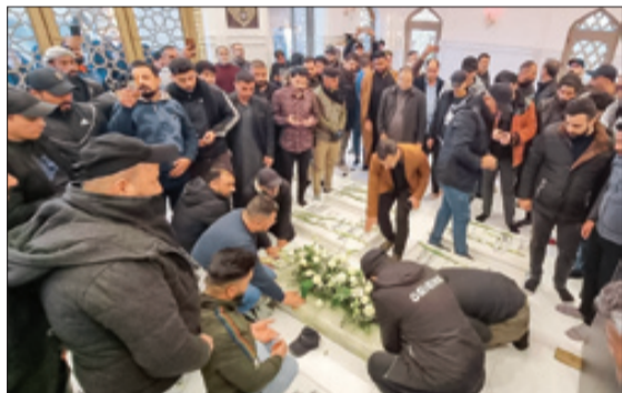
حضور پرشور زائران بر سر مزار ابومهدی المهندس