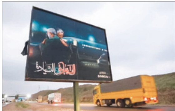
تابلویی از شهید سلیمانی و ابومهدی المهندس در جاده‌های عراق