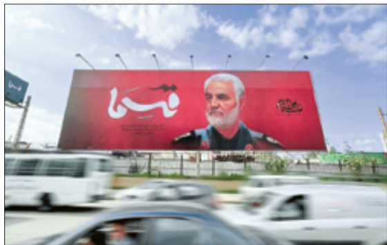
دیوارنگاره شهید سلیمانی در مسیر فرودگاه بیروت در لبنان