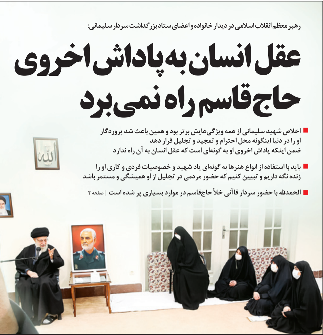
رهبر معظم انقلاب در دیدار خانواده شهید سلیمانی و مسئولان بر گزار کننده سالگرد شهادت او، ویژگی‌های اصلی حاج‌قاسم را اخلاص و صداقت معرفی کردند