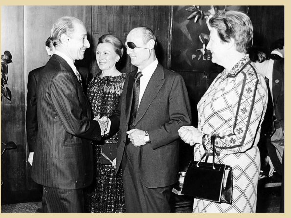
دیدار هرز تارپ با عویش دایان و همسرش، هنگام سفر به ایران

از جنگ شش‌روزه در ۱۹۶۷، اسرائیل بهره‌برداری از چاه‌های نفت «سورود پس» در شبه جزیره سیننارا آغاز کرد تا بتواند وابستگی خود را به نفت خارجی کاهش دهد، اما مایل بود مطمئن شود که نفت ایران را همچنان در اختیار خواهد کرد. (۴) طی مسافرت شاه به آمریکا در سال ۱۳۴۹، وی از سرمایه‌داران صهیونیست دعوت کرد تا جهت تشکیل کنسرسيوم نفت به ایران بیایند و سرمایه‌گذاری کنند. بنابراین ۳۵ نفر از کل کمیاتی‌ها و بانک‌های امریکا به تهران آمدند که «دیوید ایلپان» و «دیوید راکفلر» دو یهودی صهیونیست، در رأس آنان بودند. (۵) از اوایل دهه ۱۳۵۰هـ. ش. به بعد ایران از بزرگ‌ترین فروشندگان نفت به اسرائیل شد تا روابط تجاری طرفین بیش از پیش به صورت پایاپای صورت گیرد. اسدالله علم در خاطرات خود موافقت شاه را در موضوع صادرات نفت ایران به اسرائیل بیان می‌کند. (۶) در معاملات و