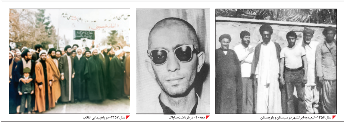
۲۰هه۴-۲۰هه۴ در بازداشت ساواک

حسرت می‌خورم که در قضایای اخیر قدر رهبری را کم می‌دانند