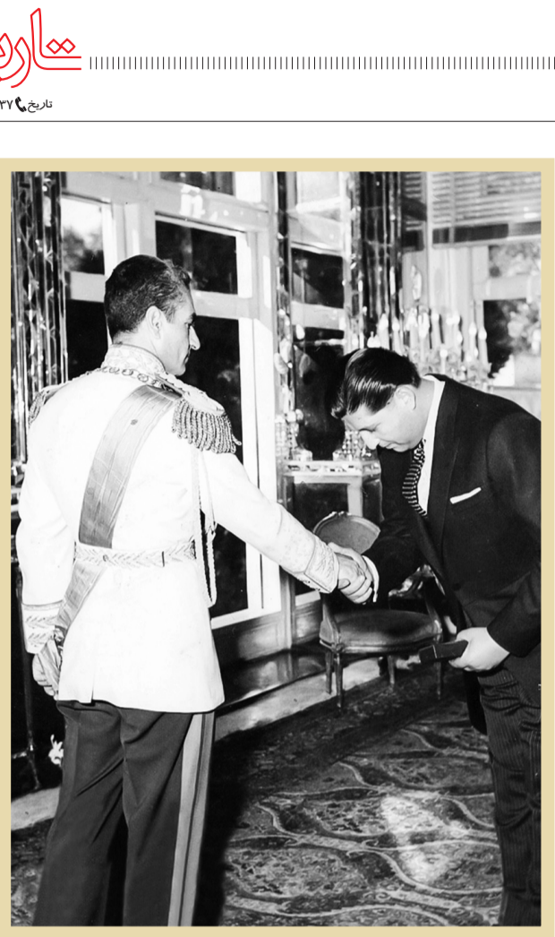
ملاقات محمدرضا پهلوی با یار مسافرتی خودآیت‌الله ارباب در تهران

«اسحاق رابین» نخست‌وزیر اسرائیل، در سال ۱۳۵۴به تهران آمد. به محض ورود وی به هتل رامسر، تعدادی از یهودیان ایرانی و کارشناسان اسرائیلی، او را شناختند و برایش کف زدند؛ در نتیجه خبر مسافرت نخست‌وزیر اسرائیل به ایران، ابتدا در میان جامعه یهودیان ایران و سپس در مطبوعات بین‌المللی منتشر شد، اما دولت ایران از انتشار آن در مطبوعات داخلی جلوگیری و سعی در مخفی نگه داشتن آن کرد!