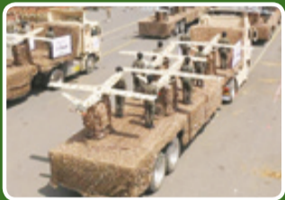
پهپادهای مشهور صمد