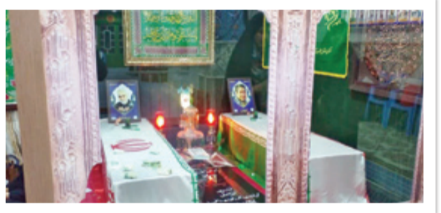
مزار شهید گمنام در میان تابوت شهدا