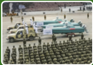
قایق‌های تندروی عاصف با کابین سرنشین