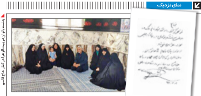
جلسه بانوان در بیت‌الزهرای در کنار حاج قاسم

حاج قاسم عزیز معنویات بسیاری داشت و بسیار رقیب‌القلب بود. گاهی حرف‌های ناگفته‌را از چشم مهمانان و دوستان‌ان می‌خواند و احتیاجی به بازگویی نداشت. ایشان گوش شنوایی برای همه بودند و با صبر و حوصله بسیار به تک‌تک حرف‌ها و درد دل‌ها گوش می‌دادند و تا می‌توانستند، گره‌گشای مشکلات‌شان می‌شدند. نگاه مهریان حاج قاسم، ادب ایشان، چهره باصلاحت و خندانش، یتیم‌نوازی‌شان و نگاه بدون تبعیض نسبت به هم اقشار جامعه زباند مردم کرمان بوده و هست. ایشان در عین اقتدار و جدبهای که داشتند بسیار رؤف و مهربان بودند و اگر کاری از دست‌شان برمی‌آمد، دروغ نمی‌کردند. همه شاخه‌های اخلاقی حاج‌قاسم، حب به ایشان را جهانی کرده است. یک‌بار در گلزار شهدای کرمان بودم، پدر و دختری را دیدم که از لحاظ پوشش به نظر ایرانی بودند، اما وقتی نزدیک‌شان شدم، متوجه شدم که ایشان از اهالی بوئنی و ساکن آلمان هستند. با صحبت و معاشرت با ایشان متوجه علاقه بسیارشان به حضرت آقا و شهید سلیمانی شدم. آنها شناخت کاملی از خصوصیات و رفتار این دو بزرگوار (حضرت آقا و حاج قاسم) داشتند. گویی در ایران زندگی می‌کردند. حرف‌های‌شان نشان از ارادت زیادشان به شهدا و ولایت‌داشت که مرزهای جغرافیایی هم نتوانست مانع این عشق و ارادت شود. در مورد مردم خود کرمان باید بگویم که حاج قاسم بزرگ و عزیز و در قلب و