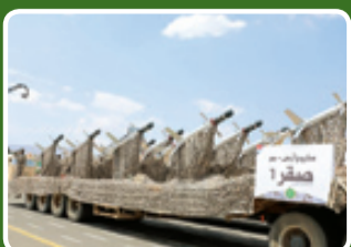
موشک‌های پدافند هوایی صقرا