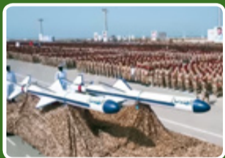
موشک کروز المندب ۲