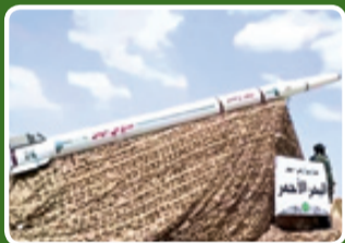
موشک بالستیک ضدکشتی دریای سرخ