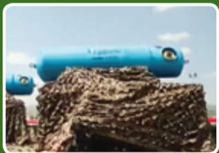
مین‌های دریایی مسجور ۱