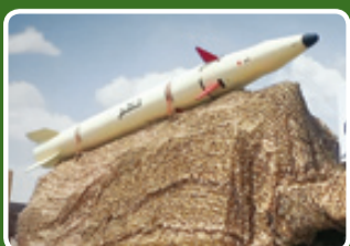
موشک بالستیک سوخت جامد حاطم

یمن گویای غلبه حجم بالای پرواز پهپادها بر گشت‌های هوایی عربستان است. موشک‌های کروز یمن از دیرباز دارای موشک‌های کروز ضدکشتی و ضداهداف زمینی بود. ارتش و کمیته‌های مردمی طی جنگ موفق به عملیاتی‌سازی هر دو دسته از این موشک‌ها شدند. اما در سال‌های اخیر موشک کروز به نام قدس که طراحی متفاوتی با موشک خریداری شده در زمان حکومت سابق یمن دارد، مشاهده شده است. موشک کروز ضداهداف زمینی قدس در سه نسل معرفی شده است و در رژه شهریور ماه، قدس ۳ با برد بیشتر رونمایی شد. این موشک به صورت تکی روی یک خودرو حمل و پرتاب می‌شود و طبق اطلاعات موجود بردی بیش از هزار و ۲۰۰ کیلومتر دارد، در نتیجه می‌تواند تمام نقاط حیاتی عربستان را تحت پوشش داشته باشد. اما در دسته ضدکشتی، کروز مندب ۲ در این رژه دیده شد که به وضوح طول بیشتری نسبت به مندب ۱ دارد. در نتیجه برد تهدید دشمن توسط کروزهای ضدکشتی یمنی نسبت به قبل افزایش یافته است. بر اساس نمونه‌های مشابه در دنیا، برد مندب ۲ دست کم تا ۳۰۰ کیلومتر قابل ارزیابی است. با این برد یمنی‌ها می‌توانند از عمق سواحل خود، بخش‌های بزرگی از دریا را تحت پوشش قرار دهند و به نوعی راهبردی ممانعت از دسترسی را به اجزا درآورند. یک کروز ضدکشتی دیگر به نام روبیح ۲۱ در رژه یمن مشاهده شد که بر اساس پهساز موشک‌های کرم ایر بشم خریداری شده در رژیم سابق یمن به دست آمده است. این موشک دارای پیران اصلی سوخت مایع راکتی می‌باشد و قدرت سرچنگی ۵۰۰ کیلوگرمی آن برای غرق کردن کشتی‌های بزرگ تجاری مناسب است، البته با توجه به ابعاد آن. برای حمله به شناورهای نظامی مناسب نیست و این وظیفه بر عهده مندب ۱ و ۲ است که قطر کم و بال‌های کوچک‌تری دارند. پدافند هوایی بخش بزرگ آسیب‌پذیری یمنی‌ها از حملات دشمن از ناحیه