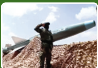
موشک بالستیک ضدکشتی محیط