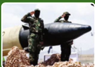
سرچنگی هدایت‌شونده موشک فلق