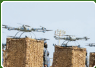
پهپادهای عمودپرواز مولتی روتور