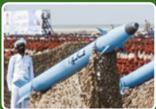
موشک بالستیک ضدکشتی فائق ۱