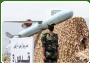
موشک کروز قدس ۳