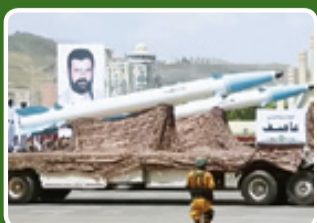
موشک بالستیک ضدکشتی عاصف