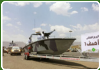
قایق عاصف با رادار جست‌وجوی سطحی

انواع راکت‌ها و نیز نمونه‌های هدایت‌شونده از آنها با دقت مناسب و استفاده علیه مواضع استقرار و تجمع دشمن و ساخت موشک‌های جدید از جمله دستاوردهای یمنی‌هاست. حملات متعدد با موشک‌های بالستیک به مواضع راهبردی عربستان در پایتخت این کشور در ریاض و برخی پایگاه‌های هوایی و نظامی و مناطق صنعتی تا برد هزار و ۲۰۰ کیلومتر، حمله با موشک‌های کروز به فواصل چندصد تا بیش از هزار کیلومتری و حملات بسیار دقیق پهپادی به تأسیسات نفتی در برد بسیار بالا در قیاس پهپادی که به شهرت جهانی دست یافت و سبب بروز مشکل برای تولید نفت عربستان حتی در حدود ۵۰ درصد برای مدتی محدود شد، از جمله دستاوردهای ارتش و کمیته‌های مردمی یمن در مقابله با تجاوز دشمن بوده است. این روند افزایش استیلا نظامی که طبق دستور قرآن کریم صورت گرفته است، همچنان ادامه دارد و رژه بزرگ یمنی‌ها به مناسبت هشتمین سالگرد انقلاب این کشور محملی برای نمایش جدیدترین دستاوردهای موشکی و تسلیحاتی آنها بود. با توجه به اینکه عربستان سعودی هیچ‌گاه سازنده‌ای برای حرکت به سوی سلاح از شرایط آتش‌بس فعلی انجام نداده و عملاً مردم یمن از فواید این آتش‌بس هم استفاده‌ای نمی‌کنند، احتمال بروز دور جدیدی از درگیری در جنگ یمن می‌رود. در نتیجه این تسلیحات جدید یمنی قطعاً در دور بعدی درگیری‌ها مورد استفاده قرار خواهد گرفت. در این گزارش به مرور سریع برخی از مهم‌ترین موارد می‌پردازیم.