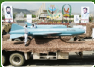
موشک کروز روبیح

ضمن اینکه عاصف از سرچنگی بسیار قوی‌تری برخوردار است و به واسطه برد بالاتر امکان شلیک از عمق خاک یمن علیه اهداف دریایی را دارد. این امر سبب پنهان ماندن و دشواری کشف پرتابگر آن پیش از شروع حمله به دشمن می‌شود. موشک‌های بالستیک زمینی بالستیک‌های زمینی از آن کان تسلیحاتی یمن در مواجهه با دشمن عربی خود بوده است. موشک‌های اسکاد خریداری شده در رژیم سابق یمن تحت بهسازی‌های مختلف قرار گرفتند و موشک‌های برخلاف اسکاد دارای بالک‌های پایدار ساز کوچکتری در انتهای بدنه است و کلاهک جنگی آن با داشتن بالک‌های کنترلی جزا، قابلیت هدایت تا لحظه اصابت را یافته است. قاعدتاً سرچنگی این موشک قابلیت جدا شدن از بدنه را هم باید داشته باشد که در این صورت کار سامانه‌های دفاع موشکی مانند پاتریوت و تاد و شاید هم آرو ۲ و ۳ برای زدن آن بسیار دشوار خواهد شد. اما به نوعی شگفتی رونمایی‌های متعدد یمنی‌ها در رژه شهریور ماه را باید موشک حاطم دانست. حاطم موشکی سوخت جامد با سرچنگی هایپرسونیک و هدایت‌شونده تا انتهای مسیر است که قطعاً سامانه‌های دفاع موشکی قابلیت مقابله با آن را ندارند. برد این موشک بر اساس نمونه‌های مشابه دست کم هزار و شاید تا هزار و ۴۰۰ کیلومتر قابل تخمین است. این موشک به واسطه سوخت جامد بودن، چابکی بسیار بالایی در آماده‌سازی دارد و با شتاب بالایی سرچنگی خود را به سرعت نهایی می‌رساند. آرایه تسلیحاتی ارتش و کمیته‌های مردمی یمن امروزه کامل‌تر از همیشه است و در صورتی که بن سلمان جاهل، حماقت‌های خود را مجدداً تکرار کند و جنگ تحمیلی علیه مردم یمن را ضمن پرداخت غرامت به پایان نرساند، این بار یمنی‌ها ضربات ویرانگری نه از جنس هشدار و تنبیه بلکه از جنس نابودسازی بر پیکر رژیم سعودی وارد خواهند ساخت.