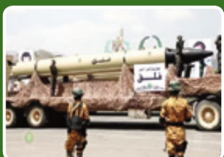
موشک بالستیک سوخت مایع فلق