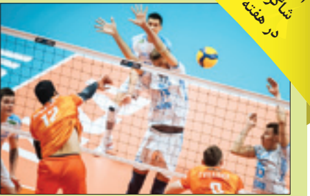
ادامه روند ناکام شاگردان عطایی در هفته شانزدهم

ادامه روند نزولی دور برگشت، سومین باخت خود را مقابل گیتی‌پسند در اصفهان متحمل شدند. صدر نشین پلانزاع لیگ که دور رفت را بدون هیچ باختی به پایان برد، در دور برگشت کارش را با شکست آغاز کرد و این روند را ادامه داد، به طوری که از چهار بازی قبلی خود سه باخت و تنها یک برد کسب کرده است! لبنیات هراز آمل در حالی بازی این هفته را با نتیجه ۳ بر یک به نماینده اصفهانی لیگ واگذار کرد که گیتی‌پسند به واسطه این برد موفق شد خود را به رده نهم جدول برساند. نتیجه‌ای که فاصله صدرنشین آملی لیگ را با شهسپاد یزد، تیم دوم جدول به چهار امتیاز کاهش داد و حالا دسترسی به صدر جدول برای یزدی‌هایی که این هفته شهرداری گنبد را در مصافی خارج از خانه با نتیجه ۳ بر صفر شکست داده‌اند چندان سخت نیست. در