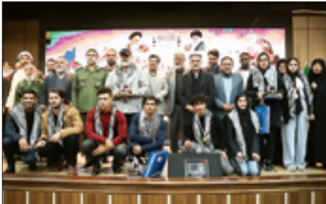
مراسم تجلیل از ورزشکاران جوانمرد برگزار شد