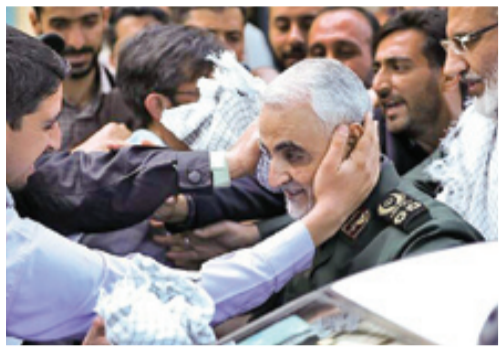
خاطراتی از حاج‌قاسم سلیمانی با مروری بر کتاب «سلیمانی عزیز»