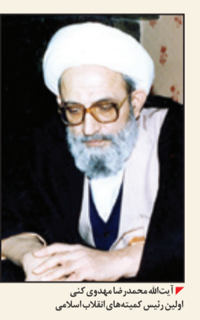
آیت‌الله محمدرضا مهدوی کنی

«در جریان پیروزی انقلاب اسلامی، به ویژه در نیمه دوم سال ۱۳۵۷ که با رهبری هوشمندانه‌حضرت امام خمینی دامنه‌اعتصابات از سرازار به کارخانه‌ها و صنعت نفت هم کشیده شد، ارتباط و هماهنگی‌های خودجوشی بین نیروهای مذهبی قابل مشاهده بود. این ارتباط و هماهنگی بین مبارزان مسلمان و روحانیون انقلابی، در این مقطع به پیدایش شکل‌هایی برای برپایی وحدایت تظاهرات‌هاانجامید. هر یک از این تشکل‌ها، در مسجد محل ساماندهی می‌شد و مبارزات منطقه خود را به انجام می‌رسانند. این تشکل‌های خودجوش علاوه بر برپایی تظاهرات، فعالیت‌های دیگری نیز داشتند، از جمله کمک به خانواده شهیدا، تهیه و تدارک لوازم پزشکی برای مواقع درگیری با نیروهای رژیم، حفظ نظم و امنیت در روزهایی که عملاً نیروهای رژیم شاه کنترلی بر