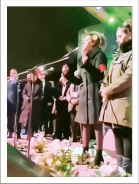
سیاهی لشکر مجازی ا یوزسیسون دوره