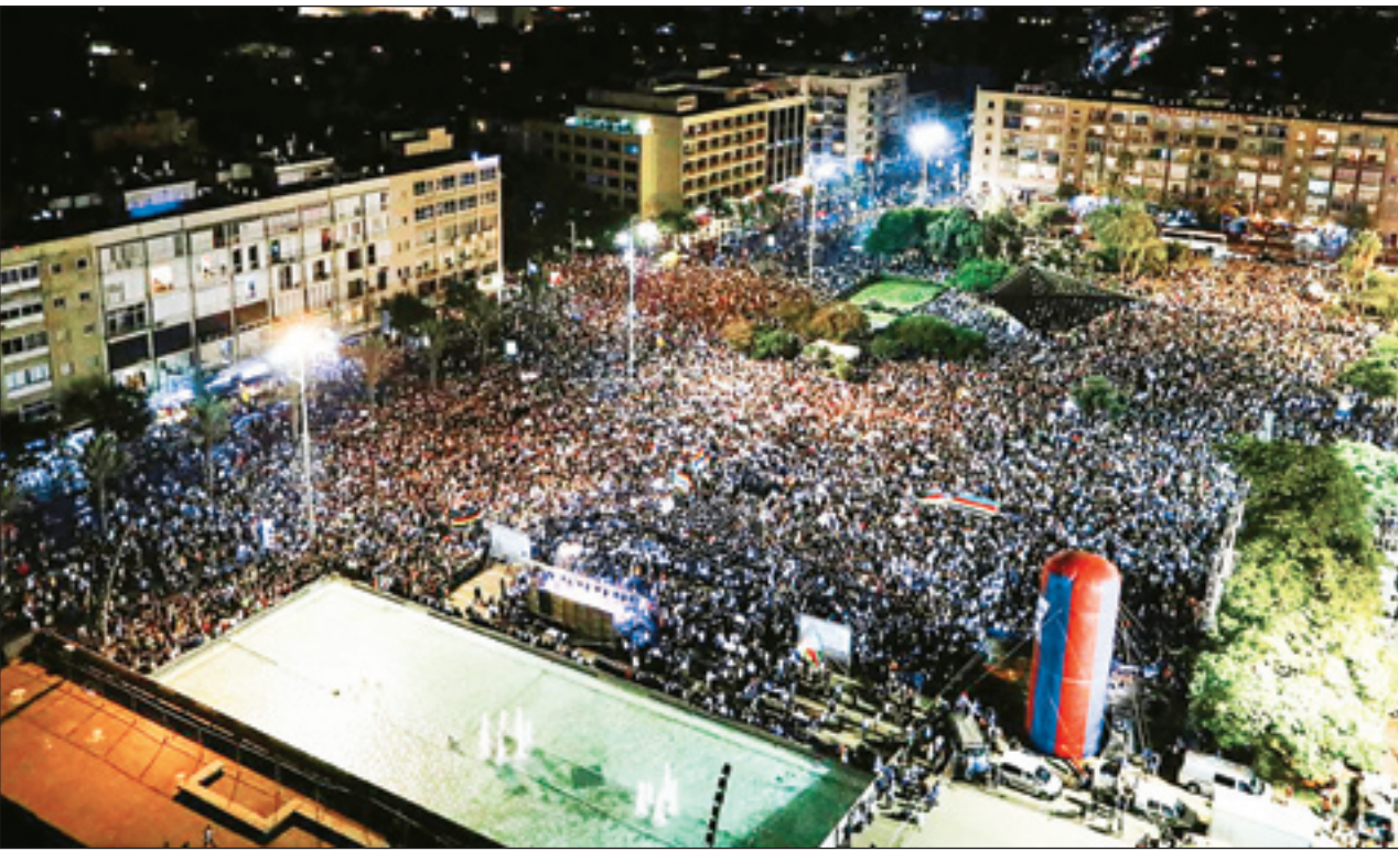
حضور حاکمان قبلی در میان جمعیت صد‌هزار نفری معترضان علیه نتانیاهو شرایط خاصی را در سرزمین‌های اشغالی حاکم کرده است