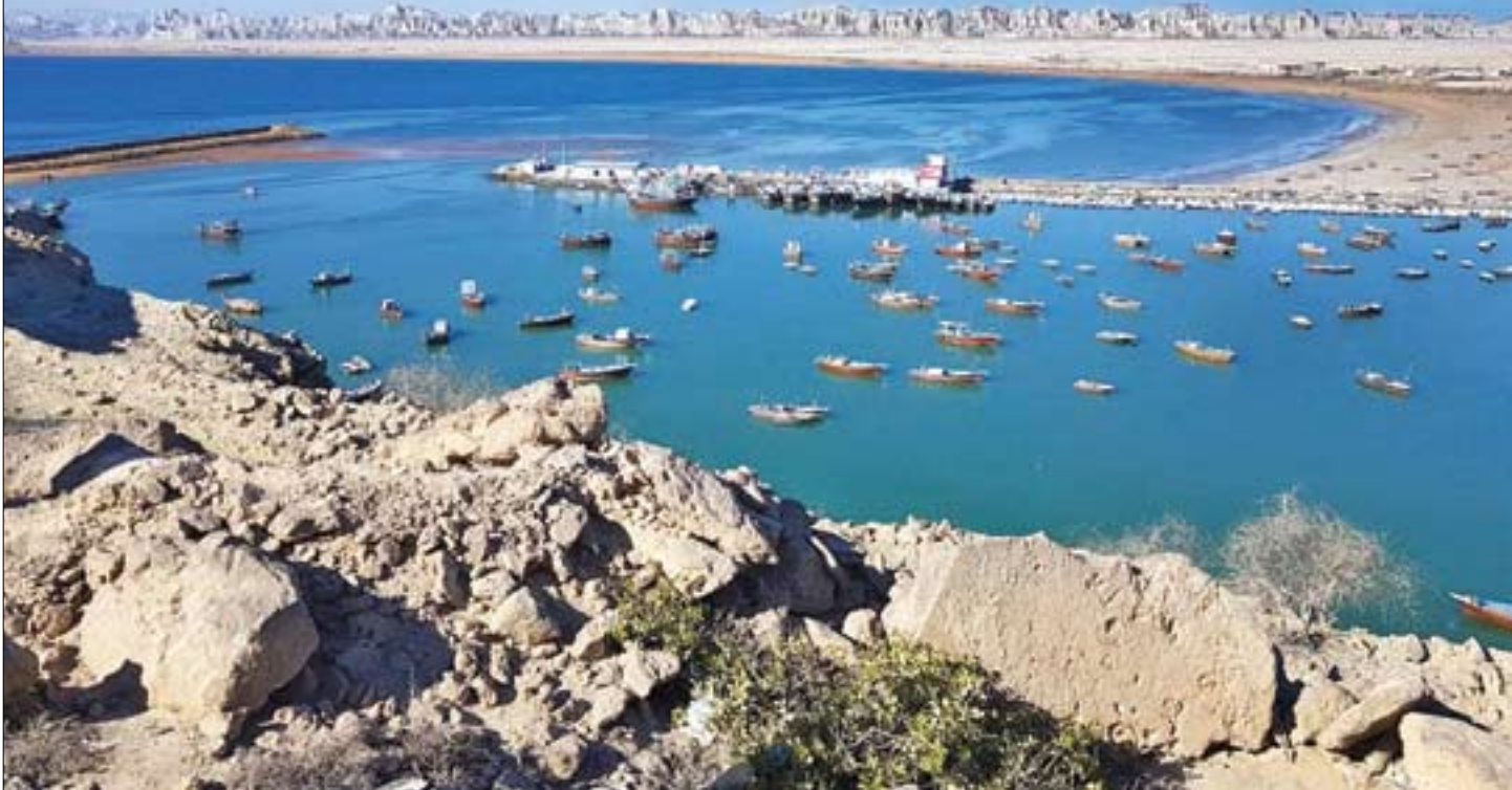
سال‌هاست که کارشناسان و مسئولان از اهمیت تنها سواحل اقیانوسی ایران در مکران سخن می‌گویند. این اهمیت حالا که برخی‌ها دنبال هلال مهار ایران هستند بیشتر شده است | رستم کریمی‌نژاد | ایرنا

کشورهای عربی حاشیه خلیج فارس، عربستان و ترکیه در تلاش هستند با ایجاد چسبندگی به یکدیگر یک هلال اقتصادی برای مهار ایران شکل دهند. «جوان» در پرونده‌ای به این موضوع پرداخته و پیشنهادهای کارشناسان را مطرح کرده است | صفحات ۹۰۸