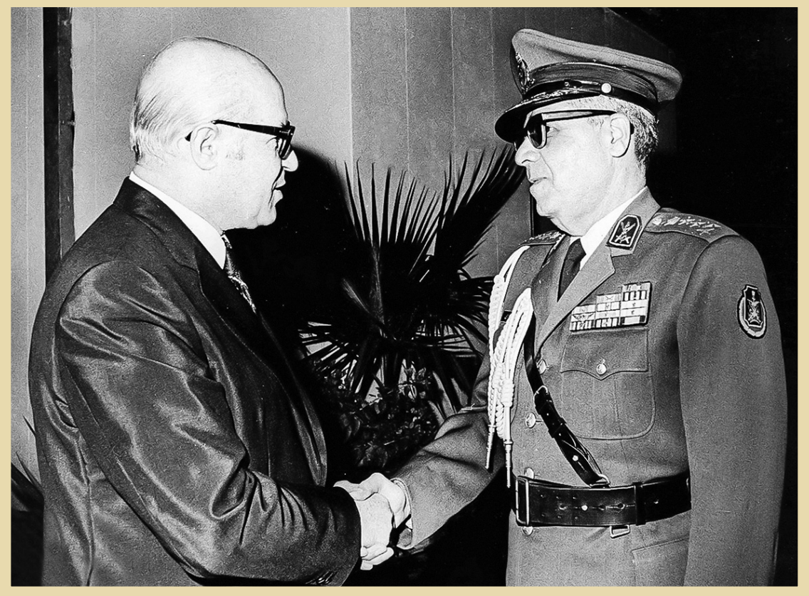
غلامرضا اژه‌اری در گفت‌وگو با جعفر شریف‌امامی

تقریباً مشخص بود برکشیدن دولت غلامرضا اژه‌اری، برای ارعاب و خریدن زمان مناسب برای شاه، در راستای سرکوب و نمایش‌هایی از قبیل تعیین دولت و مجلس ملی صورت می‌گیرد. امری که به علت سرعت انقلاب، مجال تحقق نیافت و در حد تئوری باقی ماند. از سوی دیگر، عامل مهمی که سقوط این دولت نظامی را تسهیل کرد، اعتصابات عمومی به‌ویژه اعتصاب صنعت نفت بود