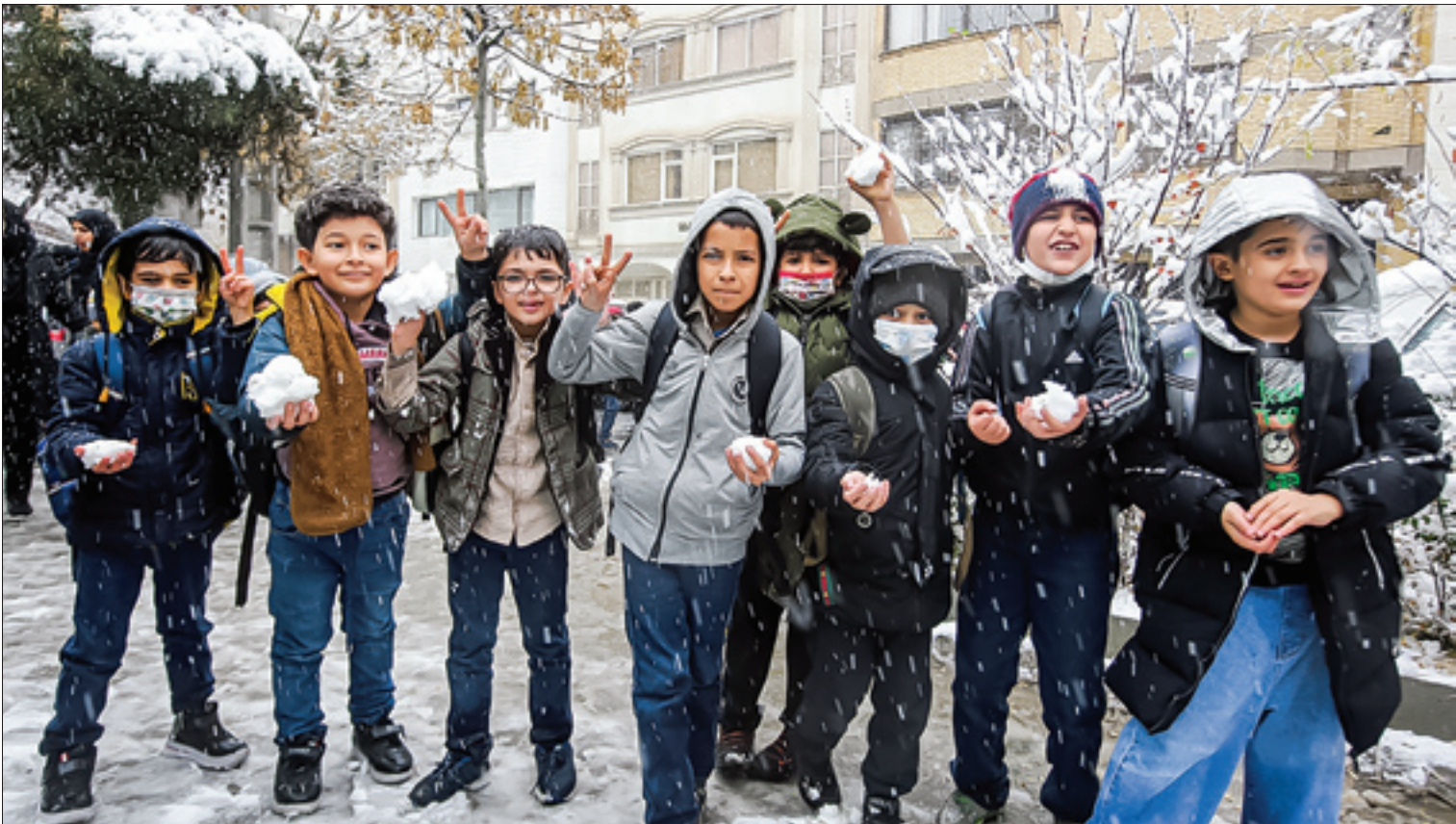
برف نو دیروز و امروز مهمان ایرانیان بود. براف این امید سبید همیشه برای ایرانیان شادی می‌آورد، بی‌خیال آنچه دشمنان برای آنان نقشه می‌کشند که «میکرو و مکرالله و الله‌خیر الماکرین» | وحیدبایات خبرنگاری دانشجو

زیرا در ساعات اولیه صبح مشتری ندارند و بیشتر فعالیت آنها در ساعات عصر است. در یکی از این ویدئوها که در بی‌بی‌سی فارسی منتشر شده مردی با حالت به‌اصطلاح دزدکی از یکی از میادین شهر فیلم گرفته و سعی می‌کند صدای خود را نیز تغییر دهد و به اصطلاح تودلی کند، آنگاه از «شجاعت» کسبه در اعتصاب سخن می‌گوید! آقای مأمور بی‌بی‌سی که خودت با هراس از شجاعت کسبه می‌گویی، کسبه در این بخش از بازار تا ساعت ۱۰ صبح مغازه باز نمی‌کنند، چون کسی برای خرید نقره جات جهاز عروس ساعت ۷ صبح خرید نمی‌کند! کاش بخشی از آن شجاعتی را که می‌گویی خودت به‌خرج می‌دادی! یا بی‌بی‌سی شجاع‌دل یکی از آن خبرنگاران پنهان خود را در ساعت ۱۰ صبح به میان بازار تهران یا هر شهر دیگری می‌فرستاد و بخش زنده آن اعتصاب سراسری آن را به نمایش می‌گذاشت! | صفحات ۲ و ۳